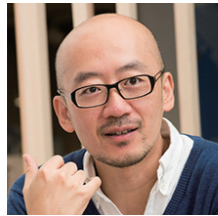
株式会社日本百貨店 代表取締役

福島県では、県産品のパッケージデザイン等の向上による商品力強化を目的に、優れたデザインの県産品を表彰する「ふくしまベストデザインコンペティション」を開催しました。 応募総数 147 商品から選ばれた受賞商品をご紹介します。